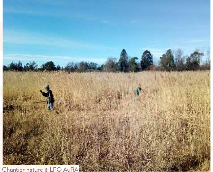
Chantier nature