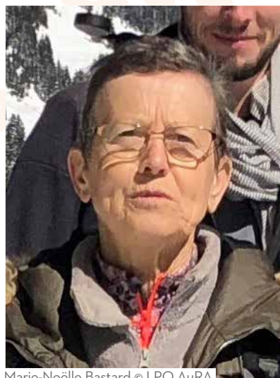
Marie-Noëlle Bastard © LPO AuRA

Rejoindre la LPO c'est apprendre à connaître la nature dans laquelle nous évoluons. C'est bénéficier de la connaissance de spécialistes pour protéger la nature. C'est avoir des conseils pour participer au vaste réseau des « Refuges LPO ». C'est aussi rejoindre des milliers de personnes qui soutiennent la même cause : tous ensemble nous sommes plus forts pour obtenir la protection de notre environnement et de toutes les espèces vivantes qui l'habitent. Elles font la joie de notre quotidien et feront, je l'espère, l'émerveillement des générations futures.