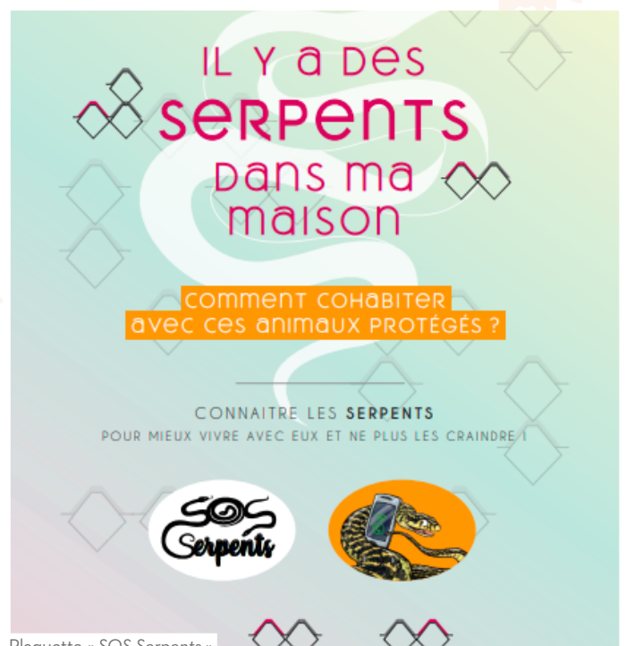
Plaquette « SOS Serpents »

Les sorties ont été difficiles en raison du contexte sanitaire... néanmoins, nous avons pu maintenir la Fête des mares au marais de l'Etournel (1 ère sortie suite au déconfinement !), les animations sur les sites d'écrasement, les sorties dans le cadre des Espaces Naturels Sensibles, la sensibilisation des scolaires... Les sorties portent davantage sur les amphibiens que sur les reptiles : nous espérons pouvoir corriger cela en 2022 !