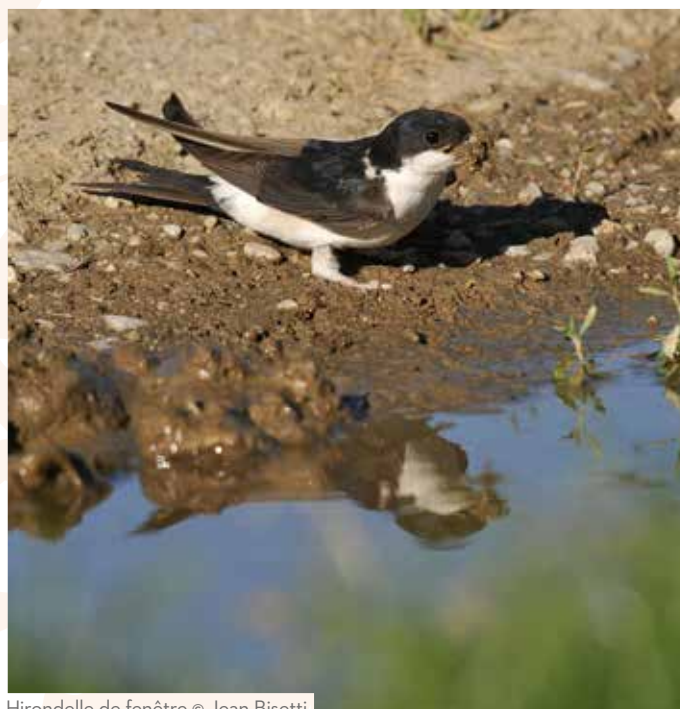
Hirondelle de fenêtre