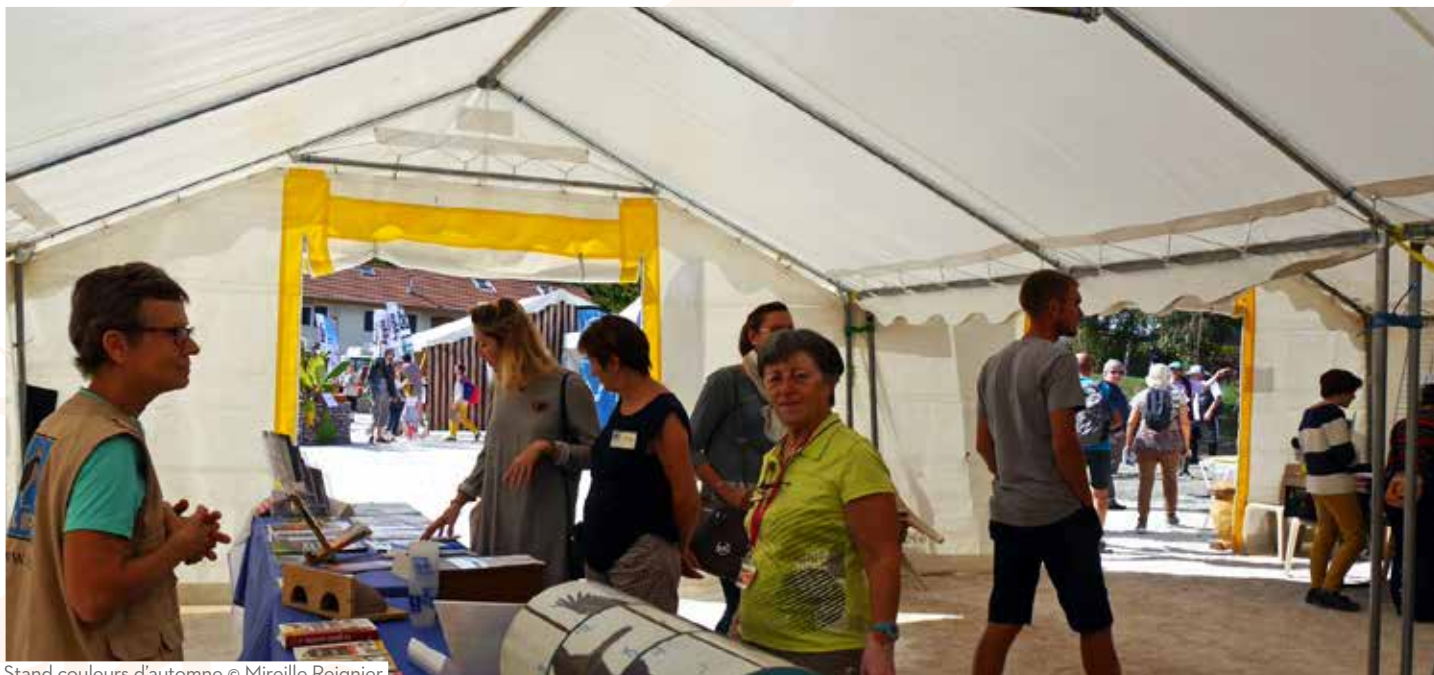
Stand couleurs d'automne