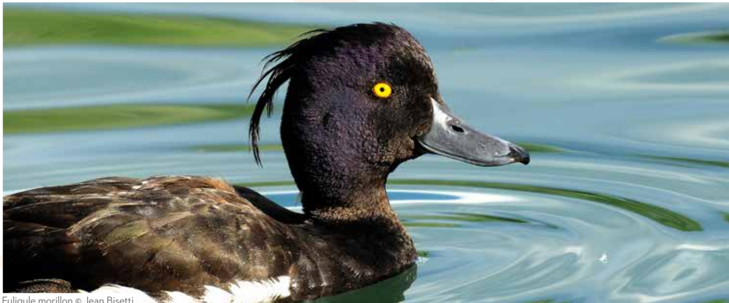
Fuligule morillon