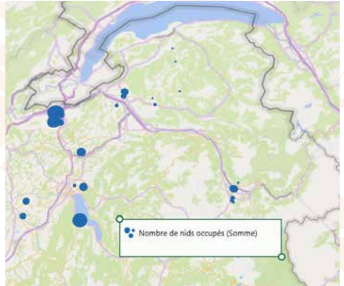
Taille des colonies d'hirondelle rustiques en 2021