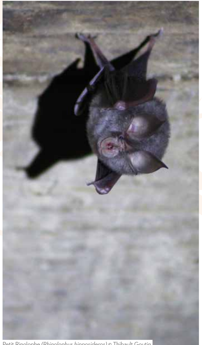
Petit Rhinolophe ( Rhinolophus hipposideros )