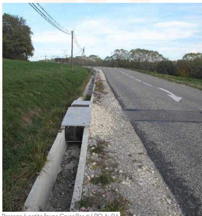
Passage à petite faune Cruseilles

Il est essentiel pour l'ensemble des sites d'écrasement d'envisager une solution pérenne pour la traversée des amphibiens et le maintien de leur corridor de déplacement.