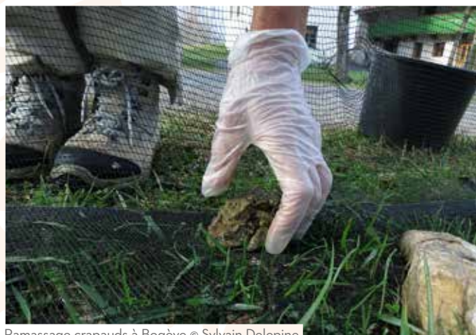
Ramassage crapauds à Bogève

Les nombreux sites d'écrasements sur le département sont suivis par différentes structures en lien avec le groupe. Les résultats de la saison sont présentés dans le tableau ci-dessous. Les sites équipés partiellement ou totalement d'un système anti-écrasement (type passage à petite faune ou détournement des amphibiens) y sont indiqués en vert. Le retour d'informations pour le site de Cranves-Sales ne concerne que l'aménagement prévu cet automne.