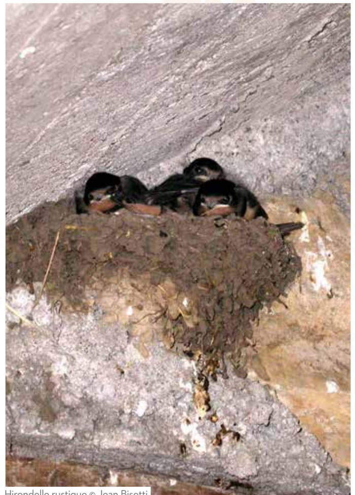
Hirondelle rustique